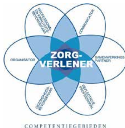
Figuur 1. CanMEDS-systematiek