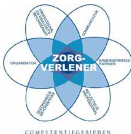
Figuur 1. CanMEDS-systematiek

In het Expertisegebied wordt tevens de aanvullende kennis, kunde en attitude beschreven die noodzakelijk zijn voor het uitvoeren van de rollen en taken binnen het deskundigheidsgebied van de verpleegkundige met een specialisatie. Deze worden uitgewerkt aan de hand van de CanMEDS-systematiek (Canadian Medical Education Directives for Specialists). Deze systematiek bestaat uit zeven verschillende rollen. De kern van de beroepsuitoefening is de verpleegkundige als zorgverlener. Alle andere rollen zijn ondersteunend voor de rol van zorgverlener. Deze centrale rol geeft richting aan de andere CanMEDS-rollen.